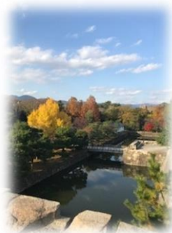
天守閣跡から庭園を望む

四季折々に趣きを持ち、広大で見事な庭園もあり、鑑賞するにはゆったり時間をかけて訪れたい名城です。