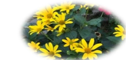
都市工房花壇秋の花