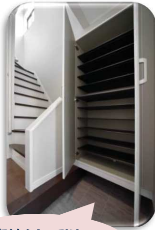
収納もたっぷり すっきり玄関