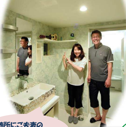
随所にご夫妻の センスが光ります！