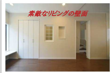
素敵なリビングの壁面