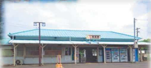
JR内房線 保田駅 懐かしい感じの駅舎です